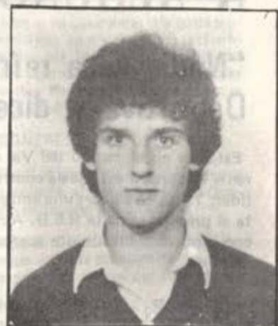
Hoy presentamos a