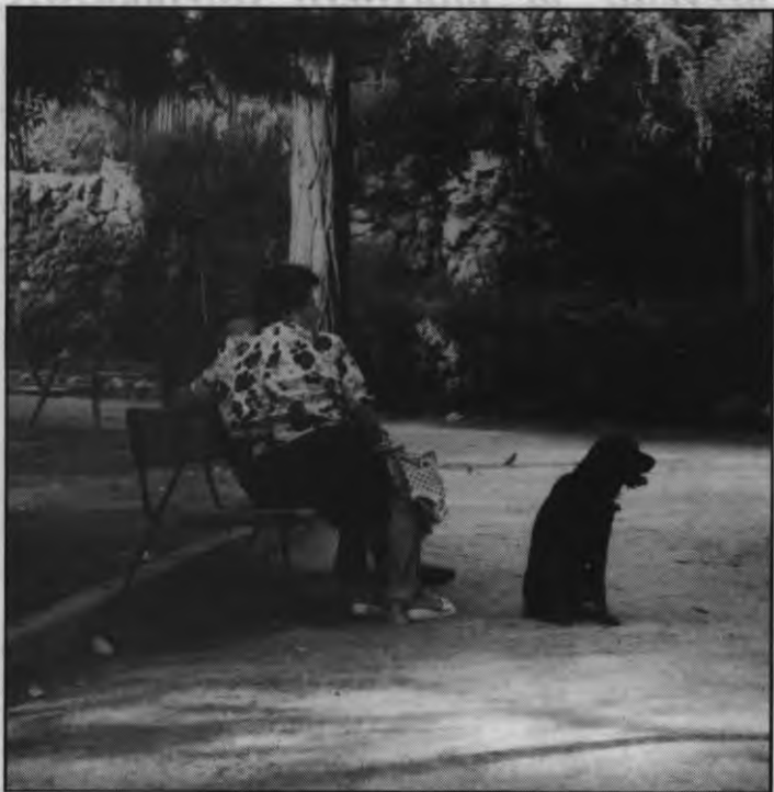
Los escolares de momento no visitarán la perrera

Con motivo del inicio del curso escolar, los responsables del Servicio Canino Municipal tenían previsto continuar con la campaña de visitas de colegiales, iniciada unos meses antes del verano. Ahora, esta experiencia la han tenido que suspender por falta de limpieza en el dispensario.