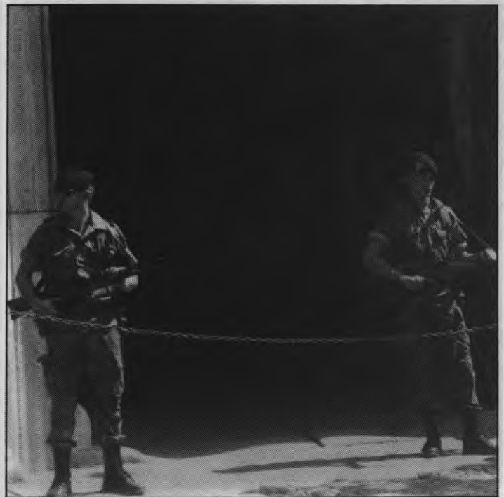
La Bripac irá a Bosnia dentro de tres semanas

De momento, las tropas concentradas en la base Álvarez de Sotomayor, en el municipio almeriense de Viator, gozan de un permiso de dos semanas, descanso que llega tras un mes de preparación y entrenamiento especial.