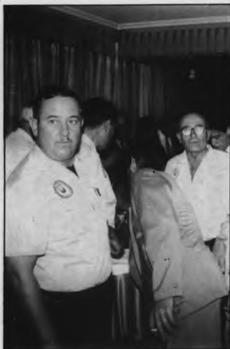
Un momento de la recepción

Además, asistieron varios concejales del PSOE y del PP, y diversos oficiales de la Brigada Paracaidista. En el transcurso del vino español se