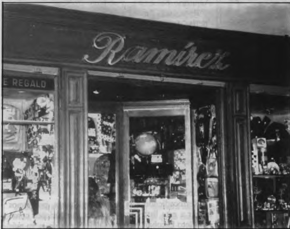
Las pequeñas empresas sufrirán más el IAE

Desde el pasado día 1 de octubre está en vigor el plazo para que los empresarios y todos aquellos que realizan una actividad comercial paguen su cuota correspondiente del Impuesto de Actividades Económicas, el temido IAE, en las oficinas municipales.