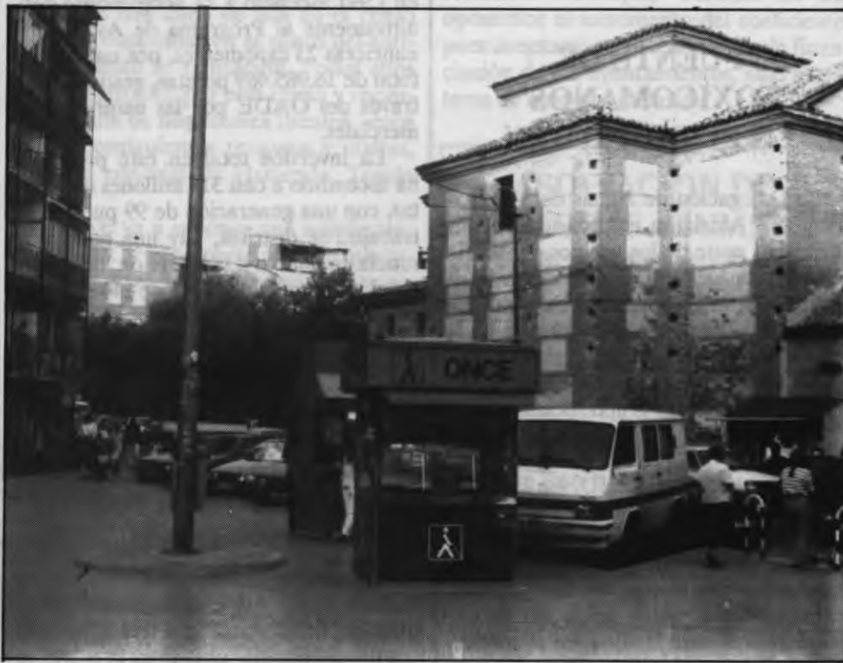
Los cupones de la ONCE son utilizados para los timos