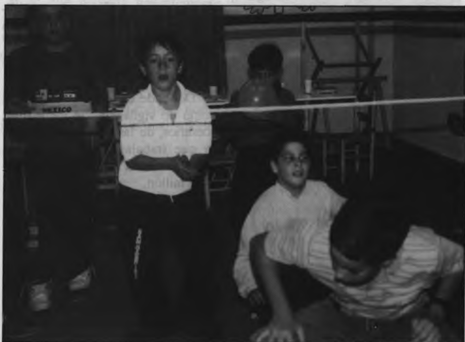
Los juegos son parte del espectáculo