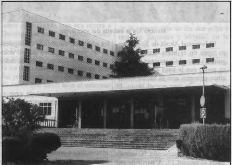
En los descampados del CEI se han acumulado restos de obras