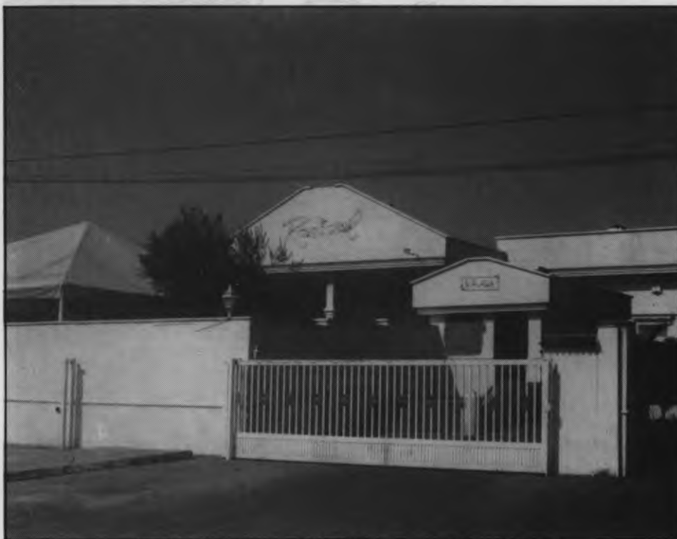
Fachada de la Discoteca Radical

Según el Ayuntamiento, esta discoteca ha realizado obras ilegales