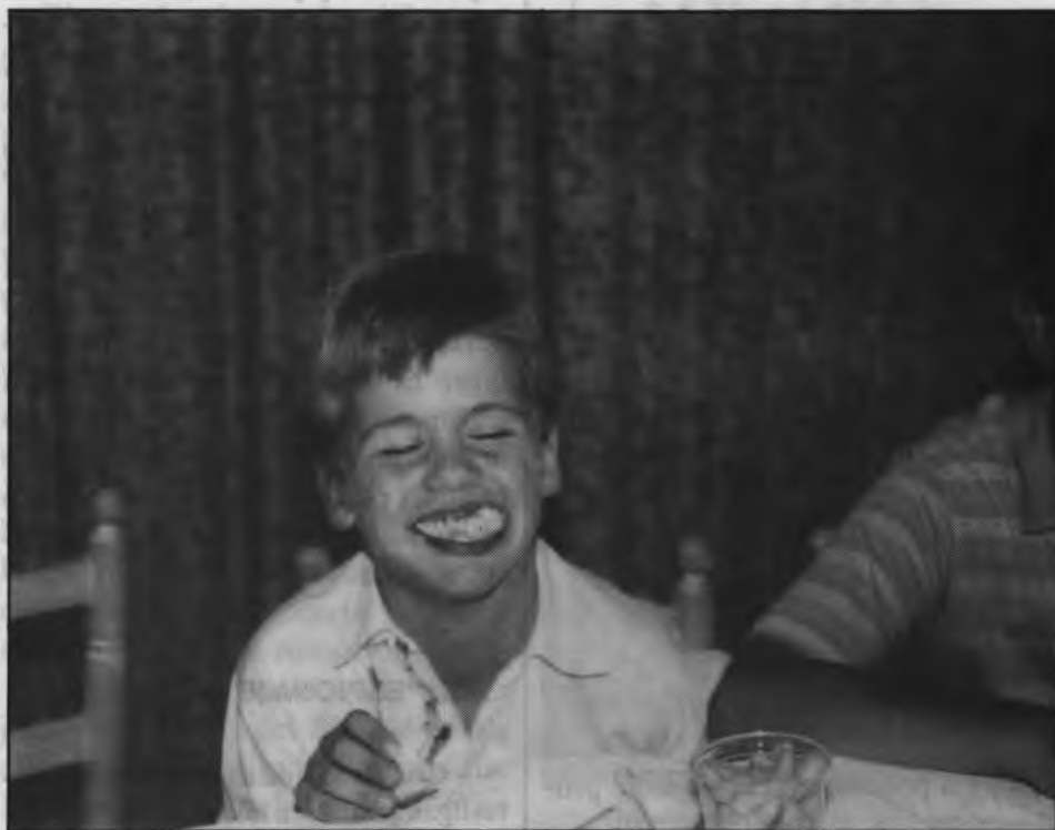
El plato por cada niño cuesta 1.500 pesetas

Los cumpleaños suelen provocar más de un quebradero de cabeza a las familias: la casa es pequeña para acoger una fiesta, los gastos de la tarta, frutos secos, bebida, sandwiches, adornos y un largo etcétera. Para los padres, más que una alegría, el día del nacimiento de su hijo se convierte en motivo de preocupación.