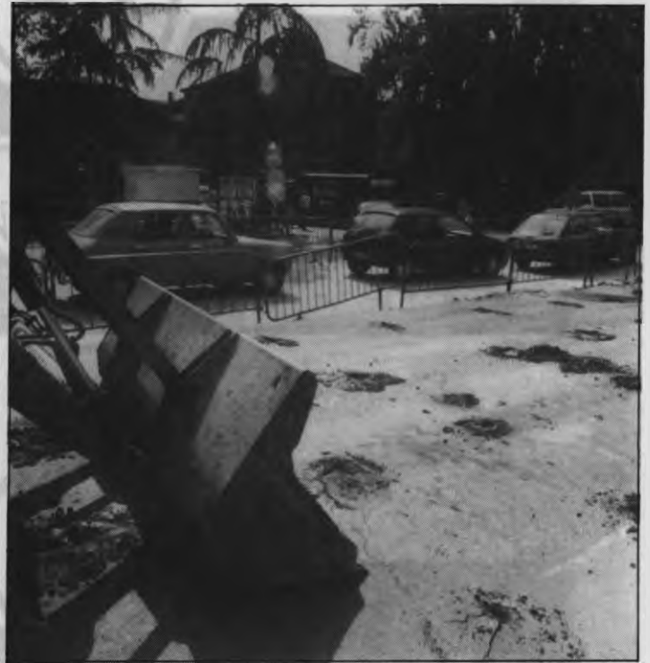
Aspecto de la Plaza de Atilano Casado