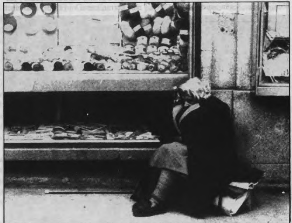
Todavía hay muchas mujeres que no denuncian los malos tratos