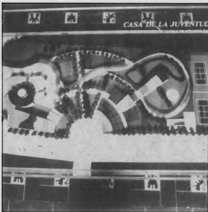
Maqueta de uno de los dos proyectos presentados

A principios de 1993 comenzará la construcción en Alcalá de la Casa de Juventud más grande de la Comunidad de Madrid. El complejo, que se levantará en unos terrenos próximos al Vivero de los Reyes Católicos, tendrá una superficie construida de 2.300 metros cuadrados, una parcela de más de 10.000 m 2 , y supondrá una inversión de 450 millones de pesetas, subvencionados por Comunidad y Ayuntamiento al 70 y 30 por 100 respectivamente.