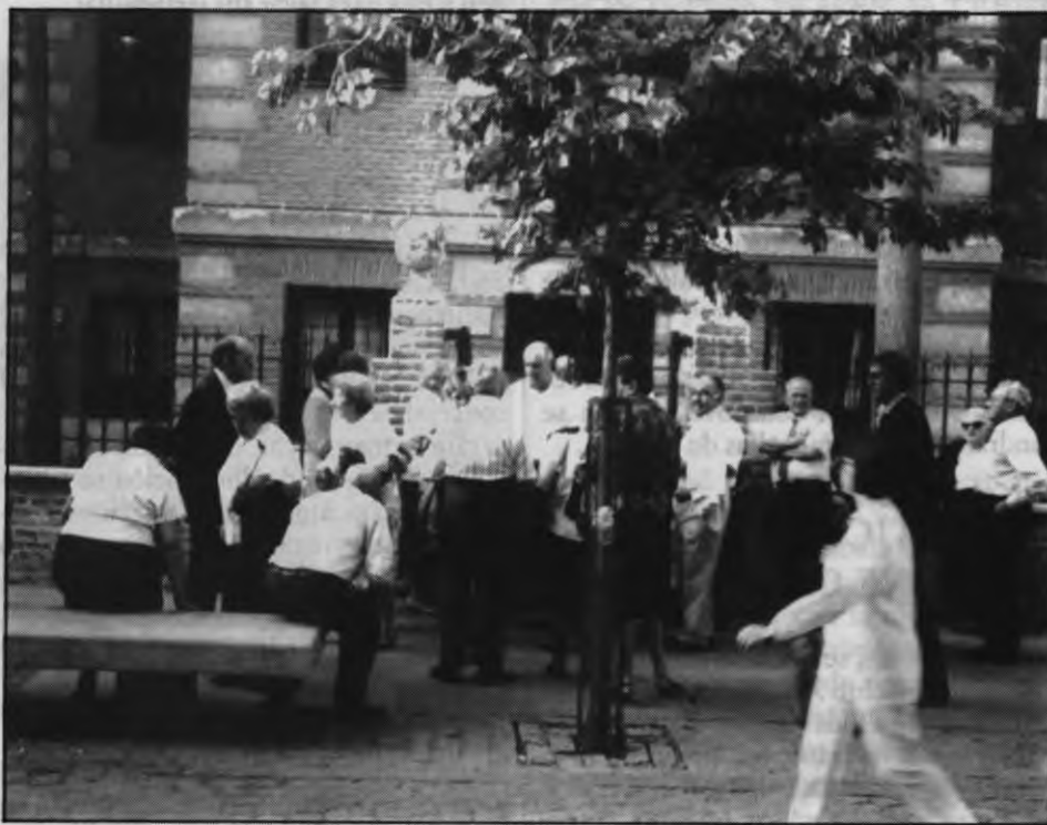
Las personas de más de 50 años son el blanco perfecto de los timos

Chorrillo, un hombre de 52 años "regaló" 200.000 pesetas. El 4 de mayo, otro señor, de 81 años, perdió 25.000. El 20 de mayo, por el timo de los cupones, un anciano les entregó a los "reyes del engaño" 700.000 pesetas.