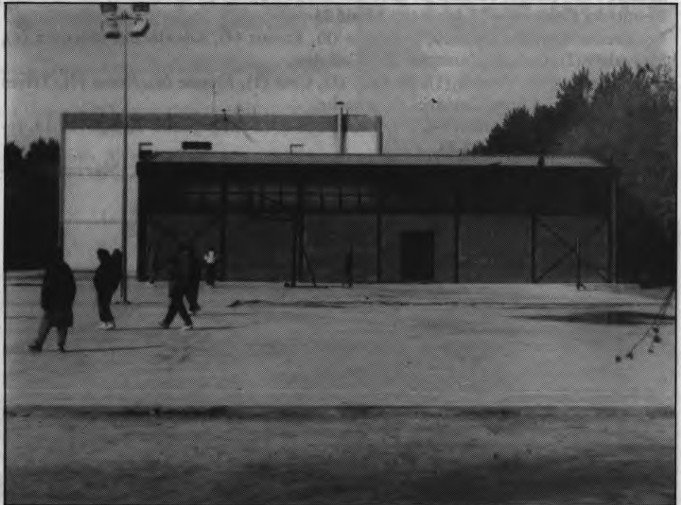
Algunos centros tienen problemas con sus instalaciones deportivas

tegración Luis Vives, uno de los ascensores no funciona. Termis señaló que "Urbano nos dijo que no se podía arreglar porque falta una firma. Mientras, un cuidador tiene que atender a 20 niños en sillas de ruedas y algunos se quedan sin