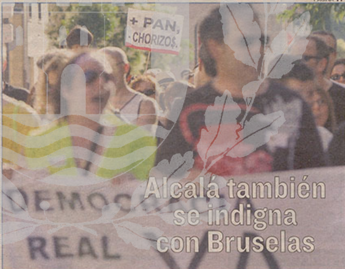
La manifestación transcurrió entre la Puerta de Madrid y la plaza de Cervantes sin incidentes