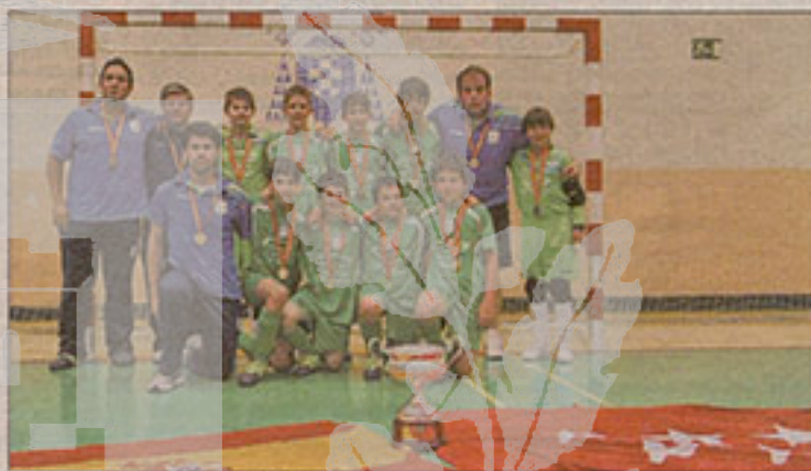
ALEGRÍA DESBORDADA. Los jugadores se abrazan tras el pitido final

CHEVROLET SPARK, TODO COMIENZA CON UNA CHISPA.