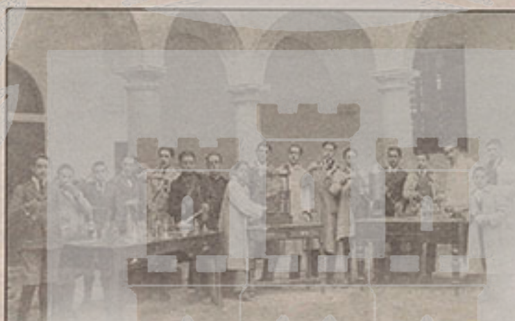
Arriba, los Escolapios en la puerta del colegio hacia 1900. Abajo, alumnos con materia del gabinete de Física y Química en el patio del colegio de San Pedro y San Pablo hacia 1920