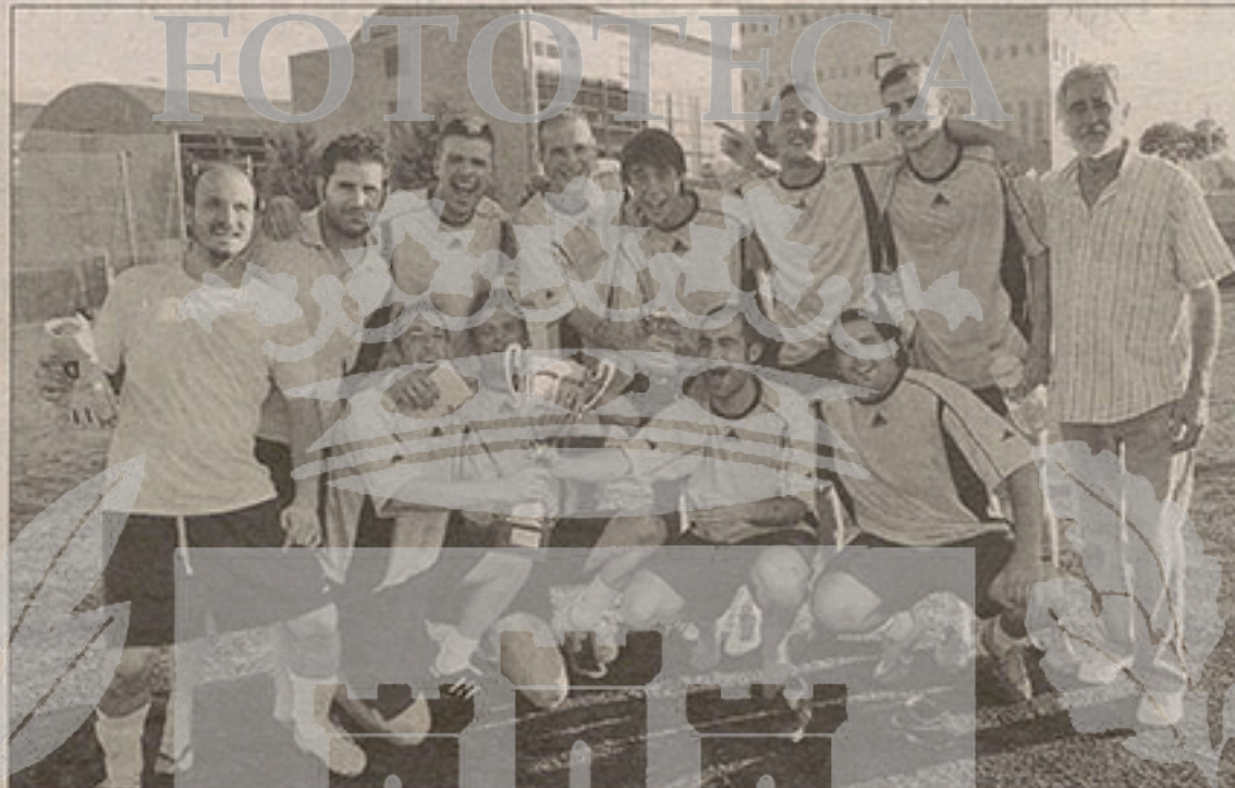
CAMPEONES. Los jugadores del Amigos F.C. celebran la victoria sobre el césped de El Juncal