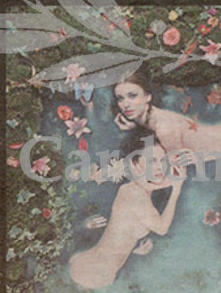
Nayades del azulejo, 2010