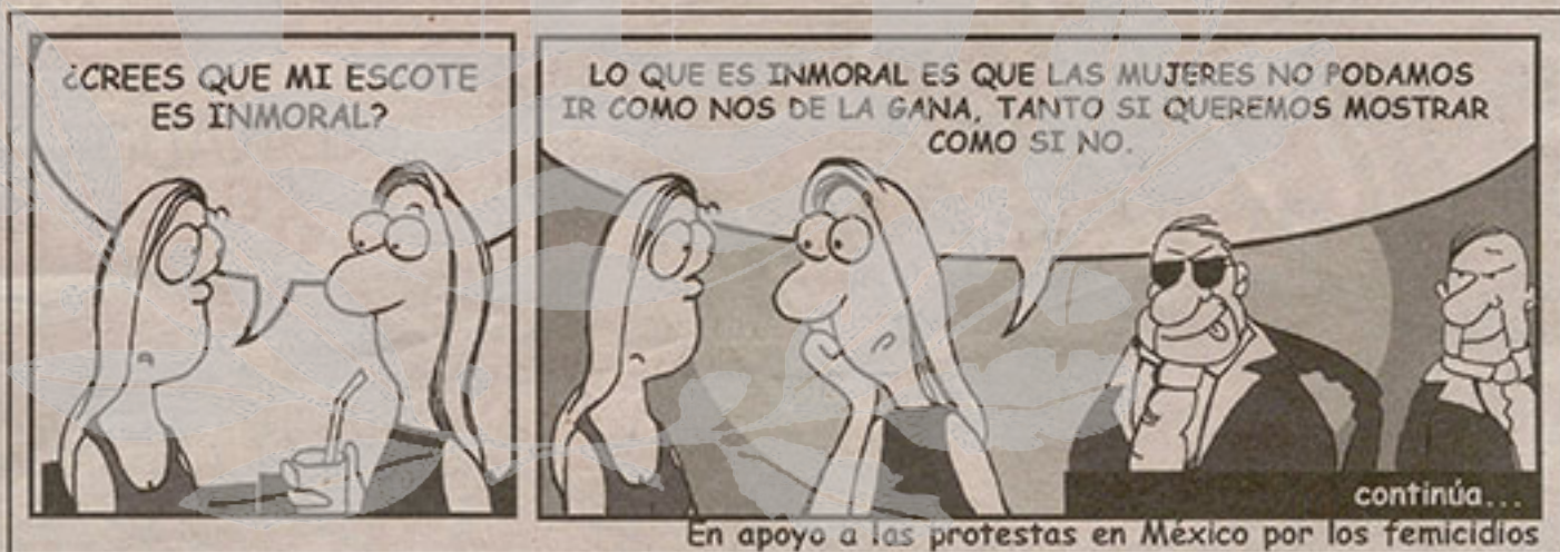
En apoyo a las protestas en México por los femicidios

Por mucho que se empeñe la directora Carmen Caffarel y el resto de responsables del Cervantes en asegurar que el Colegio del Rey cuenta con actividades culturales y que tiene un importante peso en la esencia organizativa de Instituto; la realidad prueba de que la sede complutense apenas pasa de ser una oficina. ¿O cómo se entiende que la ciudad que acogió la fundación de este organismo público encargado de difundir el español en el mundo y que es la cuna natal de Miguel de Cervantes, el escritor en español más leído en los cinco continentes; no tenga participación en festejos como los del sábado? Seguramente la respuesta vuelva a ser la que está al comienzo de este párrafo, pero no nos vale. Más bien nos ofende.