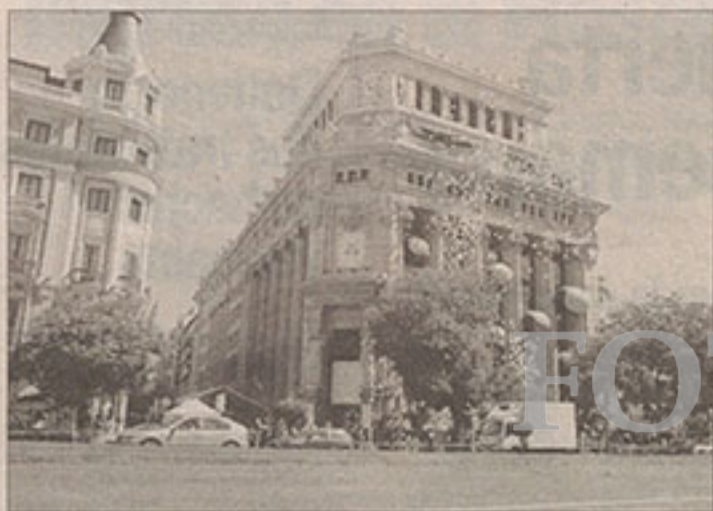
Lluvia de globos en la sede madrileña del Instituto Cervantes