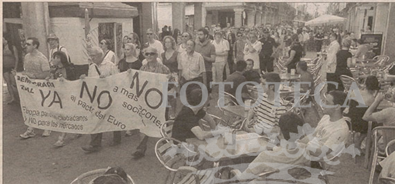
MANIFESTACIÓN. Más de dos centenares de alcaláinos asistieron a la manifestación convocada por Democracia Real Ya