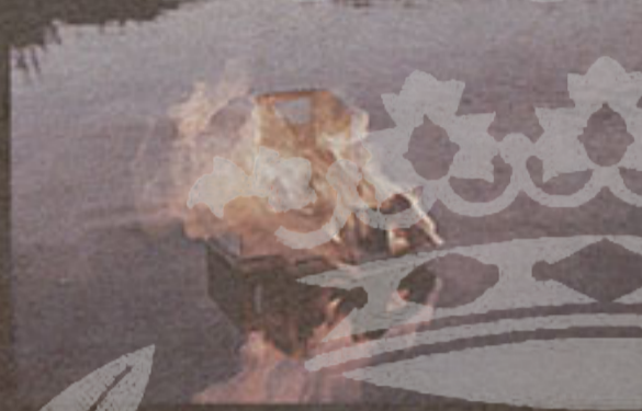
Casa de humo, 2004